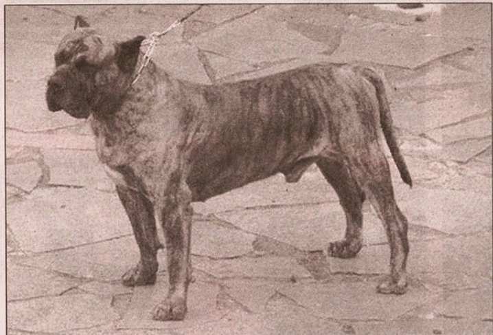
El dogo canario es una de las razas más valoradas a nivel nacional y mundial