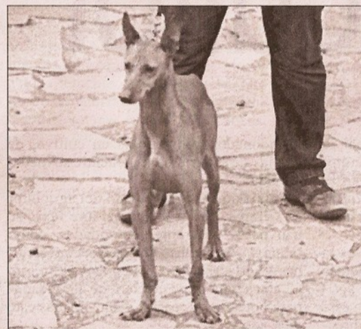
Podenco canario, nuestro perro de caza por excelencia