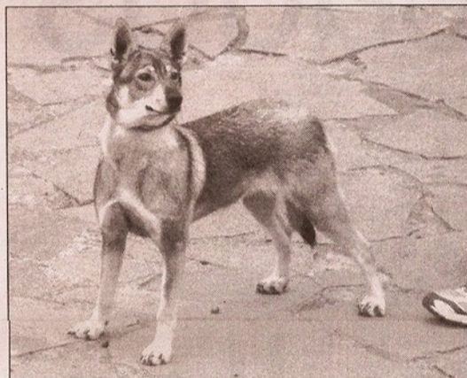
Hasta hace poco, el lobo herreño era desconocido

Ratonero palmero: terrier lupoide de tamaño de mediano a pequeño, oriundo de la isla de La Palma, donde se le utilizaba como cazador de ratas en las abundantes lonjas de depósitos de plátanos existentes en la isla. De pelo corto y raso, de color blanco con manchas que generalmente son negras, aunque pueden ser leonados, es tremendamente activo y ágil. Como ratonero es un auténtico exterminador. Siempre ha sido muy