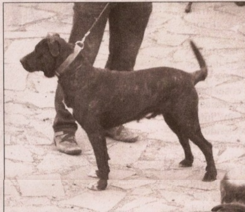
Inteligencia y valor, atributos del can majorero