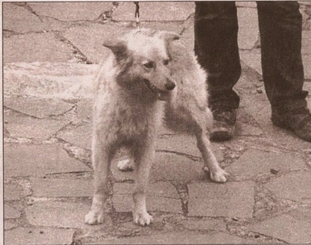
El pastor garafiano y su peculiar "sonrisa"