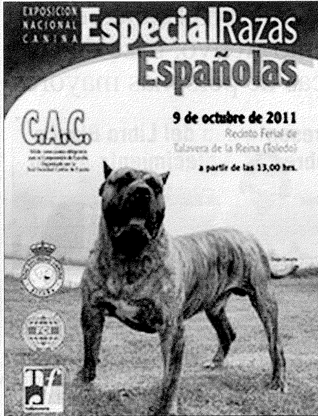
Cartel anunciador de la especial de razas españolas celebrada en Talavera de la Reina (Toledo)

No sé si estos acontecimientos y la popularidad de los mismos han llevado al operador de la compañía Binter Canarias Airlines, Can Air, a utilizar como logotipo de la nueva marca la silueta del dogo canario, a cuerpo completo y a mi entender bastante correcta, de color naranja e impresa en la parte trasera cerca de la puerta del fuselaje de los dos aviones ATR72 MDL.500. Constituye una de las mayores acciones de divulgación, dada la afluencia de pasajeros de los dos aeropuertos (Tenerife y Gran Canaria). Y con estos antecedentes y en el mejor