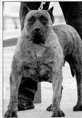
"Triana". Campeón de club 2010/2011