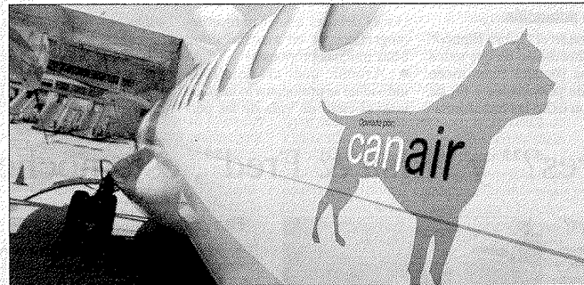
El operador de la compañía Binter Canarias Airlines, Can Air, utiliza como logotipo de la nueva marca la silueta del dogo canario